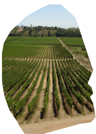
Vallée intermédiaire à la hauteur de Curicó

La production et la consommation de vin chilien sont en pleine croissance. Cette réalité entraîne, pour l'instant, un changement des comportements liés à la consommation de vin mais aussi, au regard que nous portons sur ce pays doté d'un important patrimoine vitivinicole.